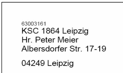
Bild 5 Einzeletikett

Im Etiketteneinzeldruck wurde bisher die Aufbereitung des Adresszusatz unterdrückt. Dieser Fehler ist in nun behoben.