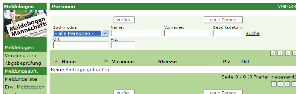
Bild 6 Voreinstellung für die Personensuche

Der voreingestellte Wert bei der Suche von Personen ist von „im Verein“ auf „alle Personen“ geändert worden mit der Option, dies später nach einer bestimmten Anlaufzeit wieder zu ändern.