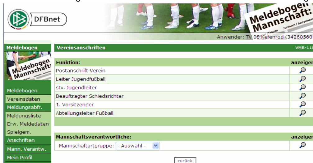
Abbildung 4 Anschriften anzeigen

Zur Ansicht für die Vereine ist die Funktion „Anschriften“ um die Auswahl und Anzeige der Mannschaftsverantwortlichen erweitert worden. Analog des Verfahrens zum Abruf der Vereinsanschriften können die Mannschaftsverantwortlichen über die „Lupenfunktion“ ausgewählt werden. Vorgeschaltet ist hier eine Auswahl über die Mannschaftsartgruppe.