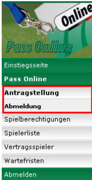
Abbildung 8 - Aussehen der Randnavigation

Der Abmeldevorgang ist dann der gleiche wie auch bei der Rolle Antragsteller Online, der hier noch mal in Kürze beschrieben wird.