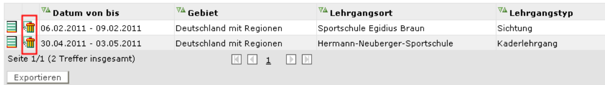
Abbildung 4 Übersichtsliste Lehrgänge

Mit der Version 3.30 ist es möglich, angelegte Lehrgänge wieder zu löschen. In der Übersichtsliste wird bei jedem Lehrgang ein Icon zum Löschen angezeigt.