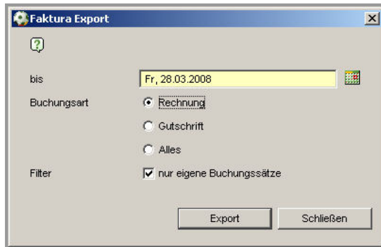
Abbildung 4 - Rechnung oder Gutschrift exportieren