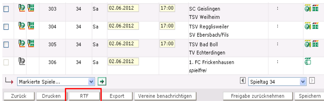
Abbildung 10 RTF Format

Für Kennungen mit der Berechtigung Meisterschaft in der Rolle Berater oder Administrator gibt es nun auch die Möglichkeit, einen Staffelspielplan im Format „RTF“ herunter zu laden.