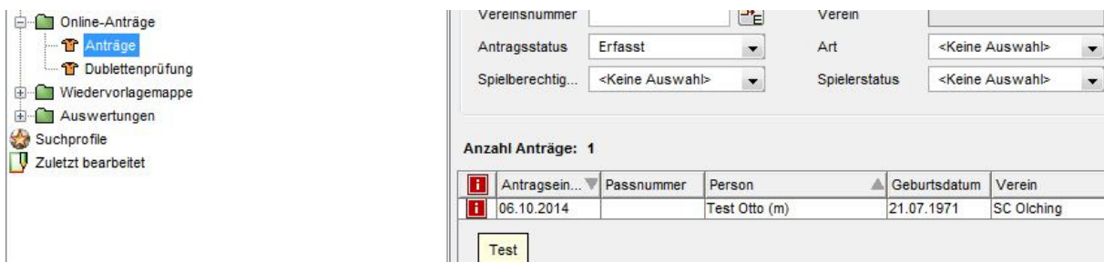
Abbildung 2: Antragsnotizen in der Arbeitsmappe "Online Anträge"

Zusätzlich wurde die Arbeitsmappe „Online Anträge“ um das Feld „Notiz“ ergänzt. Wird eine Notiz am Antrag erfasst, erscheint das bekannte Notiz-Icon in der entsprechenden Zeile. Der Inhalt der Notiz kann entweder per Mouseover oder nach dem Öffnen des Antrags unter dem Reiter Notizen gelesen werden.