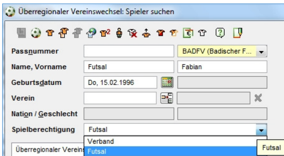
Abbildung 4: Zusätzliche Spielberechtigung "Futsal" im Antrag auf überregionalen Vereinswechsel

Im Antrag auf überregionalen Vereinswechsel muss im rechten Bereich neben der Passnummer der abgebende Verband als Pflichtfeld ausgewählt werden. Grundsätzlich werden im Bereich eines Futsal Wechsels nur die Verbände angeboten, die Futsal freigeschaltet haben.