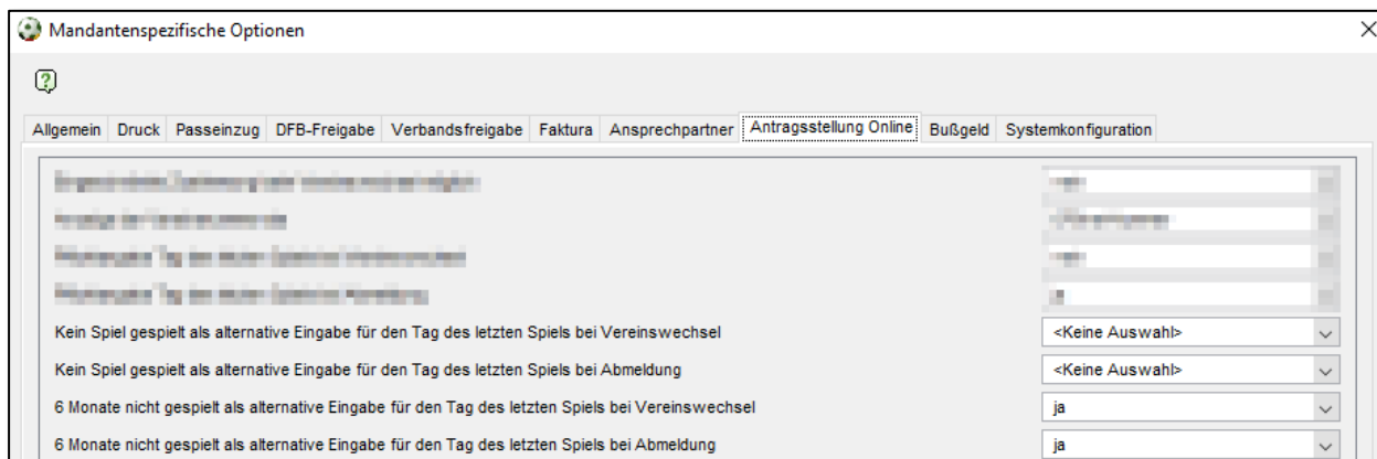
Abbildung 1: Konfiguration für die alternative Angabe zum Tag des letzten Spiels

Hinweis: Die Angabe „Kein Spiel gespielt“ führt nicht zum Wegfall der Wartefrist.