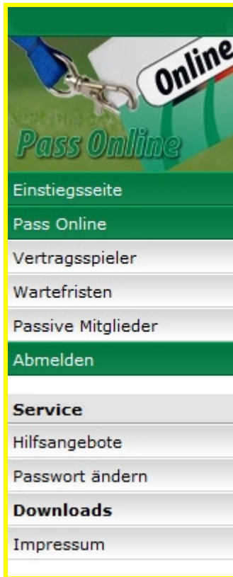
Abbildung 1 - Pass Online - Menü