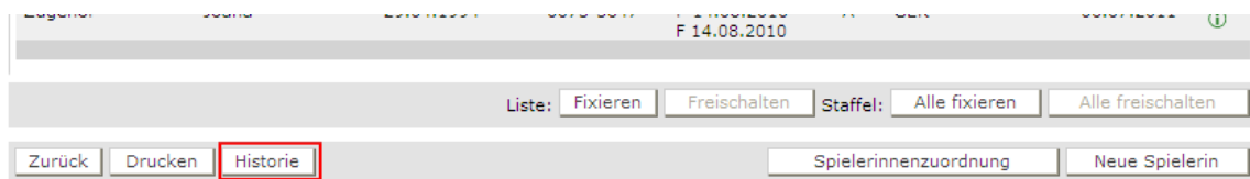
Abbildung 1: Aufruf Historie aus der Spielberechtigungsliste

Die Änderungsprotokolle können nur vom SBO-Superuser/-Admin, Staffelleiter, Sportrichter und Spielberichtsprüfer und nicht vom Verein angezeigt werden. Dazu gibt es entsprechende Buttons Historie im Fuß der Spielberechtigungsliste und der Spielerdetailansicht, siehe dazu die folgenden vier Abbildungen.