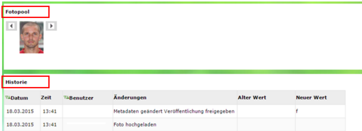
Abbildung 8: Fotopool und Historie

Der Fotopool zeigt alle bisher in das System übertragenen Fotos. Durch Anklicken eines Fotos, wird das ausgewählte Foto fokussiert und kann, wie im vorherigen Kapitel beschrieben, bearbeitet werden.