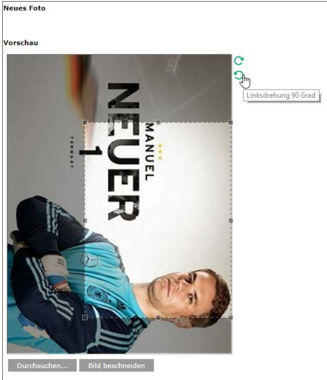
Abbildung 2 Beispiel

Bemerkung: das Bild muss in jedem Fall erst geschnitten werden, bevor es gespeichert werden kann.