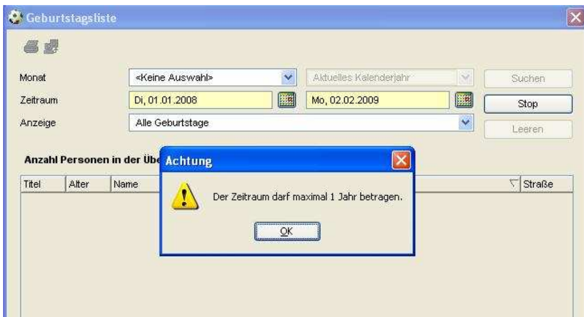
Abbildung 7 – Hinweismeldung im Kontext Geburtstagslisten

Im Rahmen des neuen Release wurden Anpassungen im Kontext der Erstellung von Geburtstagslisten vorgenommen. Wählt man in der Listbox „Monat“ den Eintrag „keine Auswahl“ aus, kann der Anwender direkt über einen Zeitraum suchen. Der Zeitraum wurde auf ein Jahr beschränkt, um zu verhindern, dass Personen in der Ergebnisliste mehrfach erscheinen. Eine entsprechende Hinweismeldung informiert den Anwender.