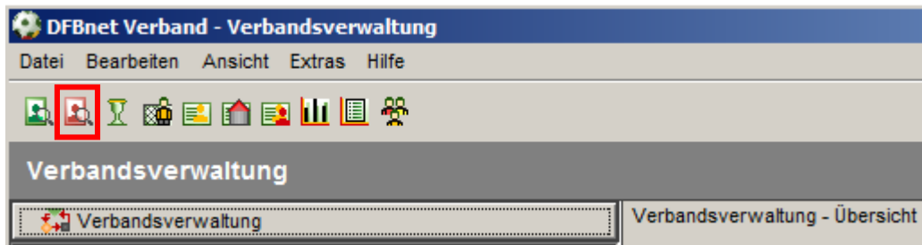
Abbildung 1: Menüband mit neuem Symbol für Funktionärssuche

Für die explizite Funktionärssuche wurde in dem Menüband eine neue Funktion mit eigenem Symbol hinterlegt. Das Symbol ist an die Personensuche angelehnt, allerdings rot eingefärbt.