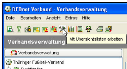
Abbildung 1 – Arbeiten mit Übersichtslisten

Durch eine Erweiterung der bekannten Funktionalität des Arbeitens mit Übersichtslisten an Verteilern ist es ab der Version 3.01 der Verbandsverwaltung möglich, Ausweise für die Mitglieder eines Verteilers zu erstellen.