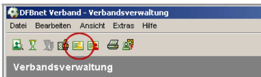
Abbildung 6 – Symbolleiste

Mit der Funktionstaste „F6“ oder über die Auswahl des entsprechenden Icons in der Symbolleiste öffnet sich der Dialog zur Anlage eines Personenkontaktes.