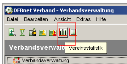
Abbildung 7 – Aufruf Vereinsstatistik

In der Komponente Verbandsverwaltung gibt es ein neues Icon zum Aufruf der Vereinsstatistik.