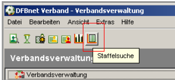
Abbildung 8 – Aufruf Staffelsuche

In der Komponente Verbandsverwaltung steht den Landesverbänden eine neue Funktion mit der Bezeichnung Staffelsuche zur Verfügung.